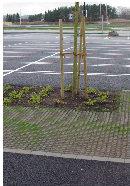
Två typer av genomsläpplig beläggning har kombinerats på denna parkeringsyta: hålstensbeläggning och genomsläpplig asfalt