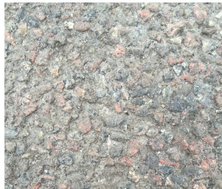
Tvättning och vakuumsugning av en yta med genomsläpplig asfalt.