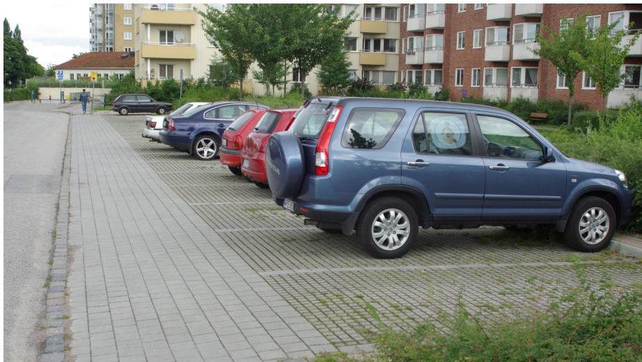
Två exempel på gräsarmerande betongbeläggningar.