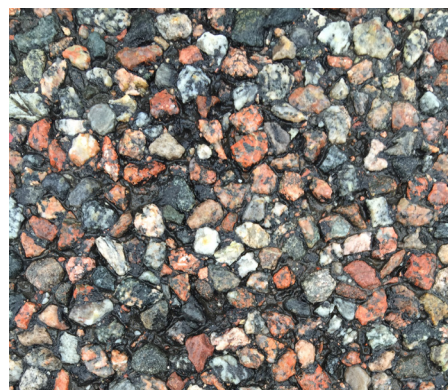
Genomsläpplig asfalt före (ovan) och efter (nedan) tvättning och vakuumsugning.