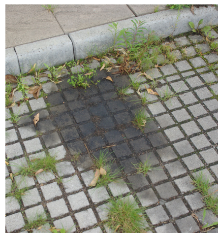
Oljespill som binds i beläggning och övre marklager kommer så småningom att brytas ner.